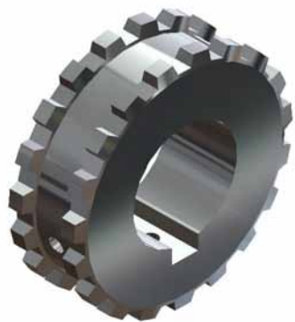
Sprockets motrices con doble hilera de dientes en acero inoxidable